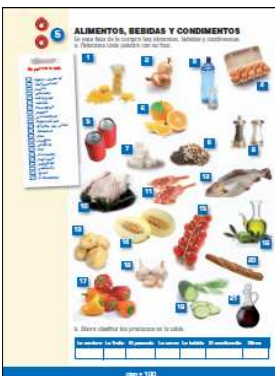
Aktívny rozvoj všetkých komponentov jazyka