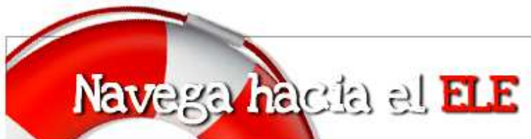
Pracovný zošit ako bohatý aktívny doplnok