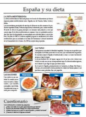
Rôznorodosť textov, aktivít, cvičení a úloh