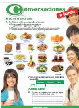
Dôraz na funkčnú stránku jazyka a kontext