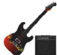
la guitarra eléctrica